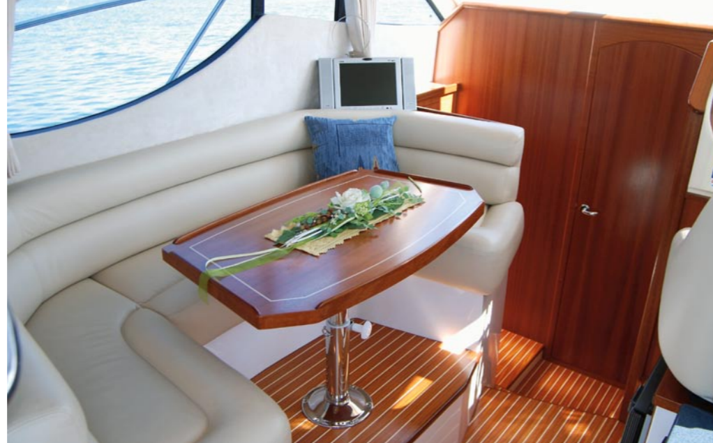
Viel Platz auf 29 Fuss: Die Galeon 290 Fly verfügt über 4 äusserst grosszügige Schlafplätze. Auch der Salon und die Nasszelle sind erstaunlich gross dimensioniert. Und die Pantry hinter dem Steuersitz ist komplett ausgerüstet.